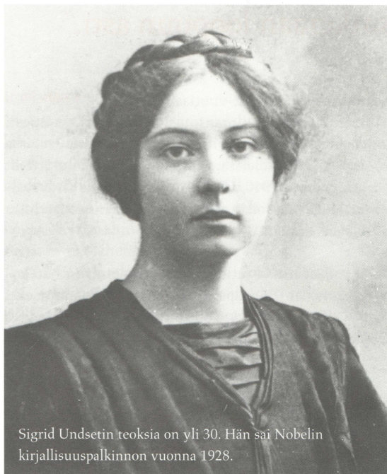
Sigrid Undsetin teoksia on yli 30. Hän sai Nobelin kirjallisuuspalkinnon vuonna 1928.

Sigrid Undsetin ehkä tunnetuin teos on vuosina 1920–1922 ilmestynyt romaanitriologia Kristiina Lauritsantytär.