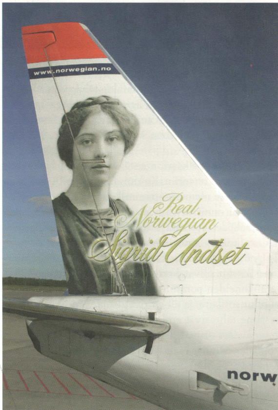
Sigrid Undsetin kuva löytyy myös lentokoneen peräosasta.

Toukokuussa 2007 avattiin Lillehammerissa sijaitseva Undsetin koti Bjerkebæk yleisölle. Koti on pyritty restauroimaan sellaiseksi, kuin se oli kirjailijan elinaikana. Norjan valtio osoittaa kunnioitusta kirjailijaa kohtaan. Sigrid Undsetin kuva on Norjan 500 kruunun setelissä ja kahden kruunun postimerkissä. ■