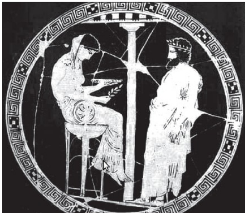
פיתיה, כוהנת אפולו, מתנבאת באורקל של דלפי.

מבין כל הכלים הידועים מתקופות קדומות בארץ ישראל, הייתה זו המדוכה, שהיא מעין קערה הניצבת על-גבי שלוש רגלים, אף כי רגלים קצרות, היחידה שניתן היה להשוותה, בגלל צורתה, לטריפוד היווני. מוצע בזה שהאמירה בירושלמי על חגי הנביא ש"ישב על המדוכה" איננה תיאור של אירוע בעל נופך פולקלוריסטי, אלא רמז להתנבאותו של הנביא, שדימו אותה לזו של הפתיה באורקל אפולו שבדלפי. הנביא לא התחבט בבעיה כלשהי, כהוראת הביטוי הזה כיום, אלא ישב על הכלי הזה ממש והתנבא.